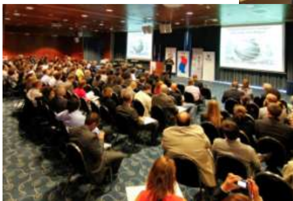
Обмяна на опит и най-добри практики