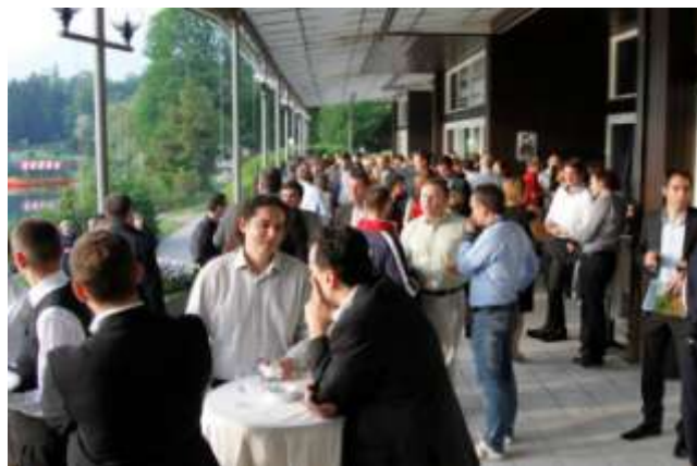
Международни B2B срещи и конференции