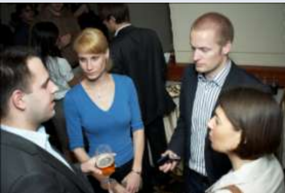
Мрежа от предприемачи и ментори